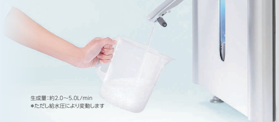
生成量：約2.0~5.0L/min *ただし給水圧により変動します